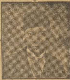
M. H. THAMRIN

Pengalaman peperangan di Spanyol dan Tiongkok memboektikan kepada kita bahwa segala lapisan rakjat maepoen istri dan anak anak akan toeroet merasai akibat peperangan. Sendjata sendjata baroe jg beroepa mesin terbang dan bom bomnja memoenahkan harta banda dan jiwa rakjat dalam segala lapisan.